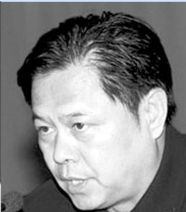
首名对法 轮功判刑 的法官 陈援朝 遭报死亡