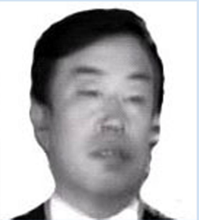
辽宁三名 法官突发 脑部疾病 死亡