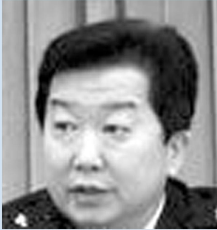
广州公安 副局长 祁晓林 上吊死亡