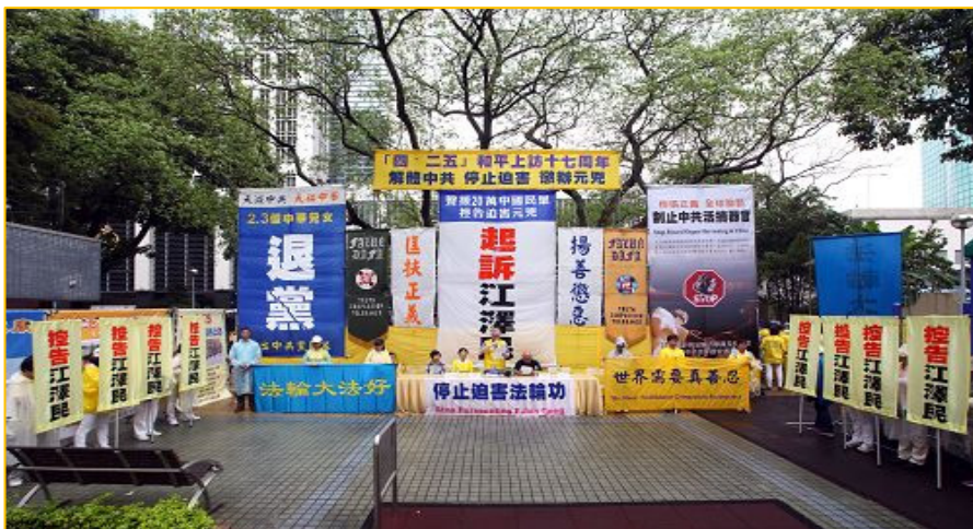
图:香港法轮功学员四月二十四日在北角英皇道游乐场举行集会,纪念四二五和平大上访十七周年,呼唤良知,呼吁制止迫害。

集会于中午在北角英皇道游乐场举行,多位议员及社会知名人士或到场声援,或透过录音发言,表达对法轮功的敬佩及支持,谴责中共迫害法轮功所犯下的罪行,支持并呼吁早日将江泽民绳之以法。◇