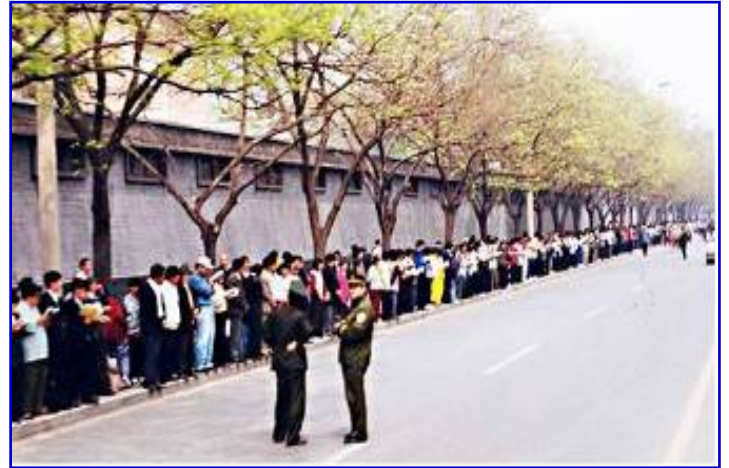
▲ 上访现场,法轮功学员秩序井然,警察悠闲聊天。

出于对政府的信任,各地法轮功学员4月25日自发来到国务院信访局(中南海旁边)和平上访,上访群众由警察引领在中南海对面沿府右街站着。虽人数众多,却安静有序,连维持治安的警察也觉得无事可做而开始闲聊。上午,朱镕基总理出来看望学员,随后的会谈解决了天津事件(下令天津公安局放人),政府给予不干涉炼功自由的承诺,学员们平静地散去。法轮功学员离开后,地上一片纸屑都没有,连警察扔的烟头都被学员们