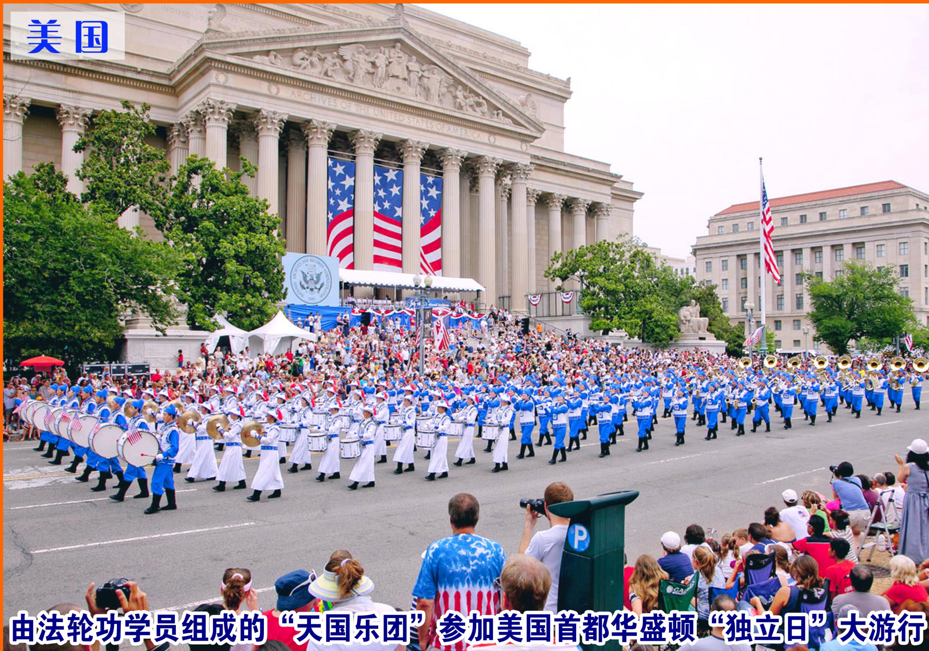
由法轮功学员组成的“天国乐团”参加美国首都华盛顿“独立日”大游行