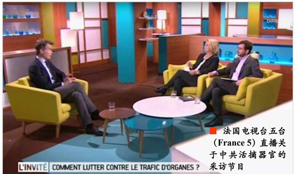
■ 法国电视台五台 (France 5) 直播关于中共活摘器官的采访节目

这些暴增的器官来自哪里？在中国，人们受传统思想影响，自发的器官捐献微乎其微。对于器官来源问