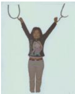
挂酷刑演示：上大（吊起来）

二零零二年五月二十五日前后我刚刚租下哈道里迎宾小区的一间民宅，因有被盯梢跟踪的法轮功学员来了我家，五月二十九日租住处被警察私自开锁蹲坑，晚十点多钟我到家时被绑架，因是半夜怕我喊，警察把我的手用电饭锅线绑住，嘴用毛巾堵上。楼上楼下的便衣共十多人忙成一片，还有两个女的把我押上车。直接