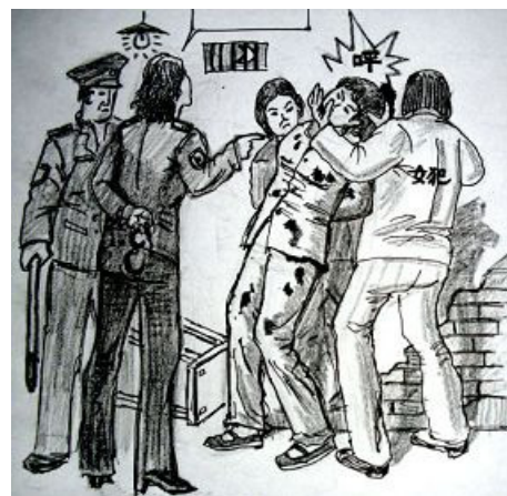
▲中共酷刑示意图：殴打、撞头