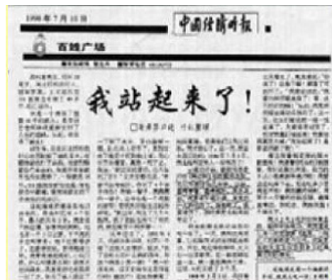
1998年7月10日《中国经济时报》刊登《我站起来了》文章的截图

岁,武安市人,曾经患白血病,多方治疗不见好转;在修大法后身体痊愈。为证实大法,1999年4.25到北京上访,回来后在武安强制办学习班洗脑三天;7.20邪恶迫害时,被610绑架至武安看守所,非法关押10天,勒索罚款5000元;回家后村派出所、乡政府不法人员经常去家骚扰,后旧病复发,于2003年含冤离世。