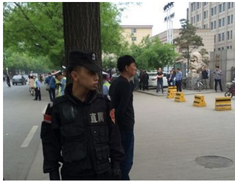
尧都区法院周围遍布警察、便衣

有些便衣拿着手机或录像机东看西走；部分特警三两成队头戴钢盔、手持警棍与盾牌绕着法院门前巡逻，部分特警拉起长长的警戒线将围观的群众拒之数十米开外；交警佯装指挥交通，实则驱赶途经此处见状好奇而驻留观看的群众。“人民”法院的电动伸缩门收拢到尽可并行通过