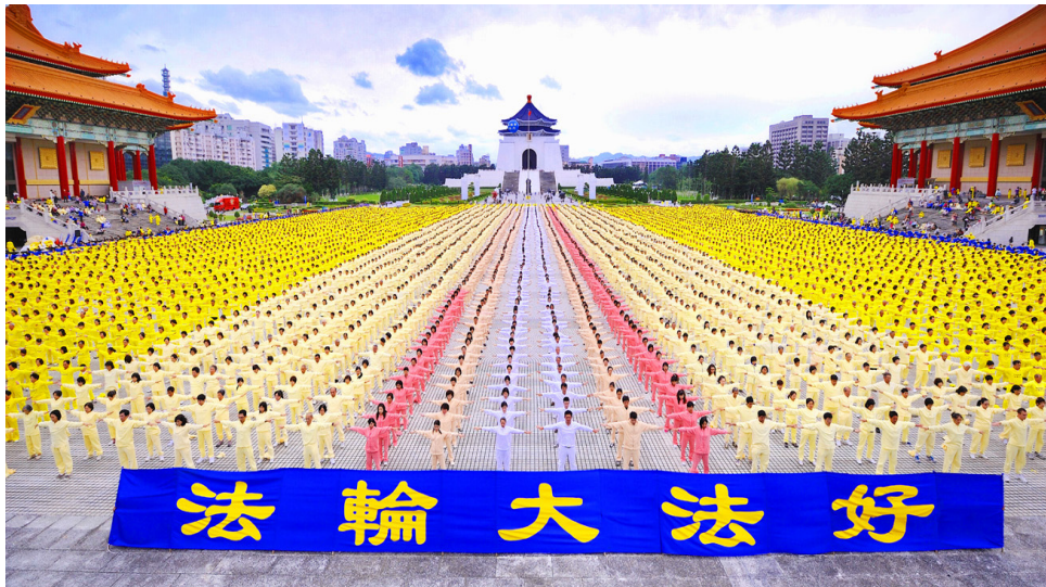
대만 파룬궁 수련생 중정광장에서 런궁

파룬궁은 오늘에 이르기까지 이미 세계 100 여개 나라와 지역에 널리 전해졌고 파룬궁의 서적은 30 여가지 언어로 출판발행하였고 아울러 파룬따파 (falundafa.org) 인터넷에서 무료로 내려 받을 수 있다. 리홍쯔 선생과 파룬따파가 받은 여러나라 정부의 여러가지 표창, 지지 의안과 편지는 3000 여개를 초월했다. “진, 선, 인 (真、善、忍)”의 신앙은 세계 각 민족의 애대화 존경을 받고 있다. 하지만 중국대륙 한 곳에서만 잔혹한 박해를 받고 있다.◇