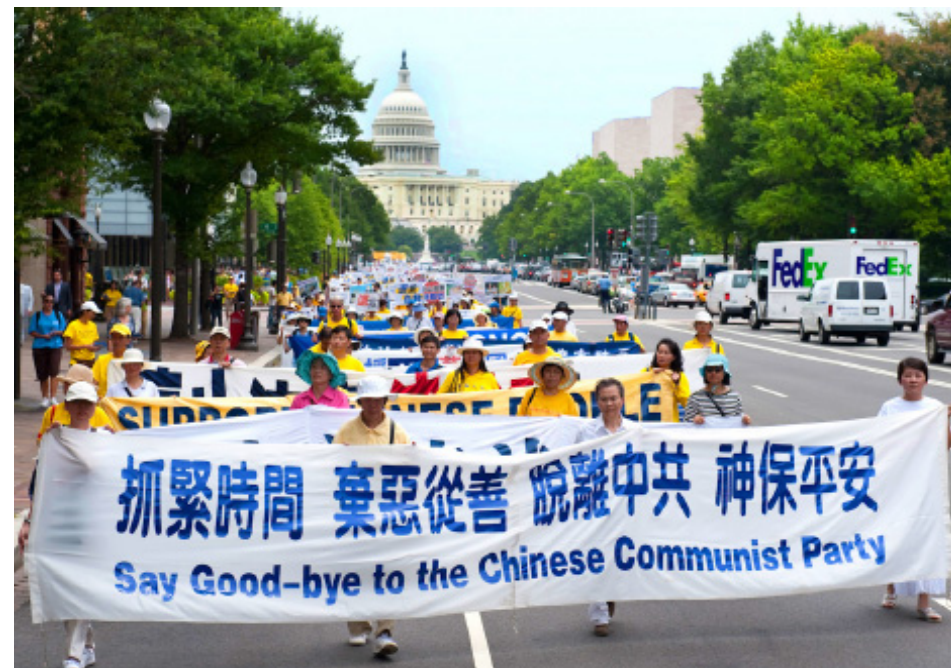
해외 대륙 중공 탈출 성원 대 시위행진

방법 2, 해외 전자 우편으로 freeget.ip@gmail.com 에 우편을 보내세요. 내용 을 임의로 하고 제목을 임의로 (비우지 마세요) 하세요. 10 분 내에 몇 개 IP 주소를 얻게 되는데 인터넷 봉쇄 돌파에 쓸 수 있습니다. 인터넷 봉쇄를 돌파하고 밍후 이왕을 방문하는 것을 환영합니다 : www.minghui.org