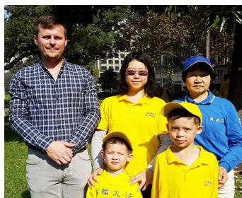
格兰与妻子、儿子及岳母