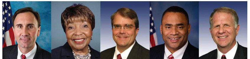
미국 텍사스에서 온 5명의 국회의원들이 세계 파룬따파의 날을 축하하다.(왼쪽부터 미국 국회의원 피트 올슨, 에디 버니 존슨, 존 칼버슨, 마크 비시, 테드 포)

그들은 원래 고혈압, 통풍, 위장병 등의 질병이 있었는데 얼마 안 가서 모두 좋아졌다. 주변 구역에는 탄원인이 적지 않았지만, 그들 구역은 매우 평온했다. 상급 지도자도 그들 덕분에 좋은 일이 생겼고, 연말에 두 사람은 모두 상을 받았다.