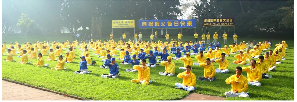
清晨，悉尼海德公园里法轮功学员集体炼功，安静祥和。（2016年5月）