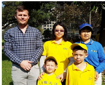
格兰与妻子、儿子及岳母