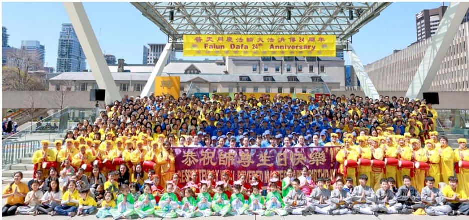
▲ 2016 年 5 月 3 日，加拿大多伦多法轮功学员在市政府前的菲利普广场庆祝 5 月 13 日“世界法轮大法日”。