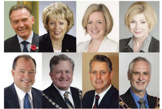
▲ 加拿大各级政要于 2016 年 5 月褒奖法轮大法，祝贺法轮大法弘传世界 24 周年，庆祝“世界法轮大法日”。图为发出褒奖与贺信的部分政要。