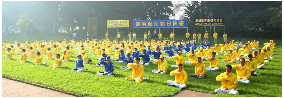
清晨，悉尼海德公园里法轮功学员集体炼功，安静祥和。(2016年5月)