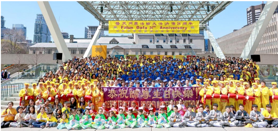
▲ 2016 年 5 月 3 日，加拿大多伦多法轮功学员在市政府前的菲利普广场庆祝 5 月 13 日“世界法轮大法日”。