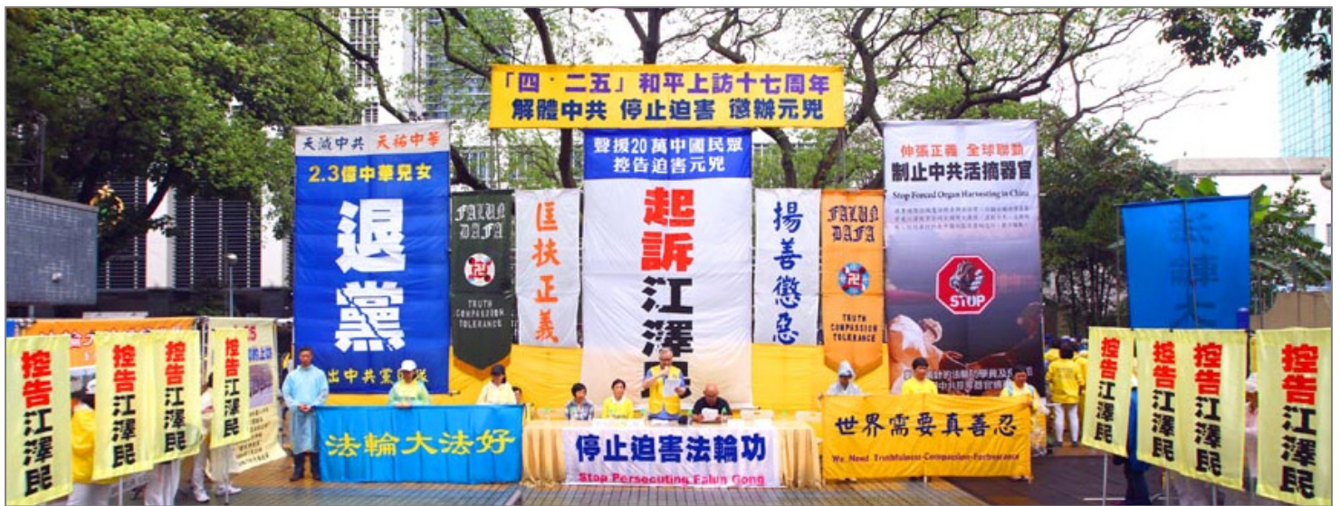
▲ 香港法轮功学员4月24日在北角英皇道游乐场举行集会，纪念“4·25”和平上访17周年。