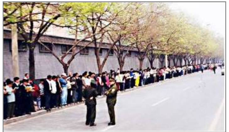
▲ 上访现场，法轮功学员秩序井然，警察悠闲聊天。

1995年，江泽民开始兜售“三讲”，无论中共怎么卖力推广，全国从上到下没有几个当作什么著作去学，但是江泽民却到处都能看到《转法轮》这本书，也知道