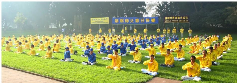
清晨，悉尼海德公园里法轮功学员集体炼功，安静祥和。(2016年5月)