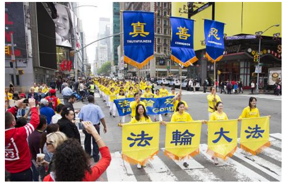
■2016 年 5 月 13 日，近万名来自世界各地的法轮功学员在曼哈顿举办盛大游行，传播大法的美好，并呼吁世人了解真相。