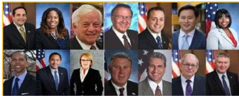
图: 单独给法轮大法颁发褒奖的纽约州众议员们