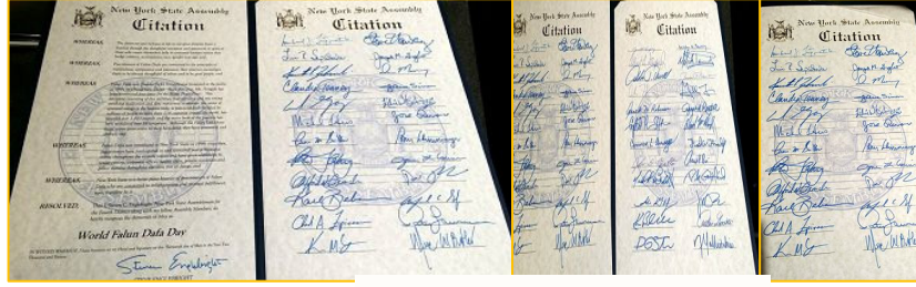
纽约州众议院褒奖令