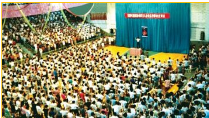
图：一九九四年七月第二期法轮功学习班，于大连机车体育馆

深入浅出地讲述了法轮大法博大精深的法理，让我们听到了闻所未闻的佛法。明白了人生的真谛就是要返本归真。修炼法轮大法就可以达到这个目的。因为法轮大法是教人按‘真、善、忍’的标准修心向善，从做好人做起，做更好的人，做超常的人。我深深地被吸引了，悟到了师尊为我净化身体是叫我能修炼的，从此我义无反顾的走上了法轮大法的修炼之路。”（选自《明慧网》文章《回忆当年师尊为我净化身体的神迹》）