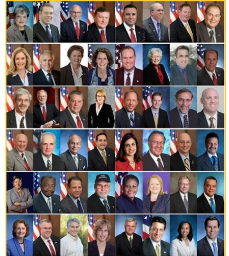
图: 共同签署褒奖令的四十八位州众议员

【明慧网】(明慧记者采菊纽约报道)二零一六年五月庆祝第十七届世界法轮大法日期间,美国纽约州六十位州众议员发来褒奖和贺信,祝贺法轮大法日,颂扬法轮大法“真、善、忍”是普世价值,赞扬法轮大法对社区的贡献和法轮大法弘传世界的盛况。四十八位州众议员,共同签署了第四选区众议员 Steven Englebright 发起的褒奖令。