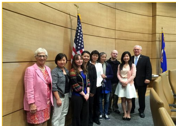
图: 发起明州 SF2090 议案的两位参议员与法轮功学员合影

全世界知道他们对人权的践踏。”“SF2090 议案会帮助制止未经许可从囚犯身上摘取器官。只要我们