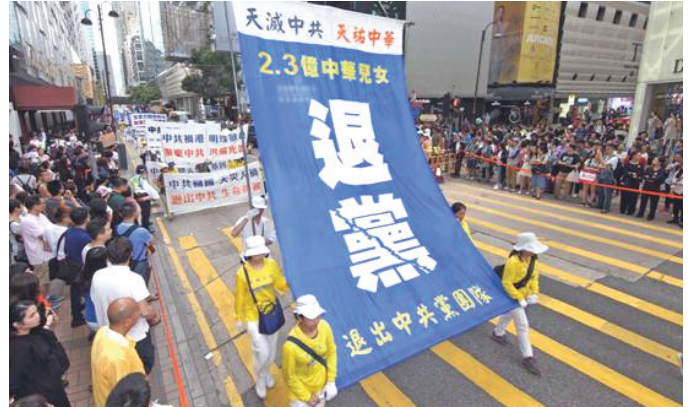
▲2016년 5월 8일 홍콩에서 중국인 2억 3천만 명의 '3퇴'를 성원

나는 이어서 말했다. “중공은 나치당 보다 더 나빠. 나치당은 주로 외국인을 살해했지만, 중공은 중국인을 죽였어. 나치당은 전쟁 년대에 사람을 죽였지만, 중공은 평화 시기에 사람을 살해했지. 나치당은 4천만이 넘는 사람을 죽였는데, 중공은 역대 운동으로 중국 사람 8천만을 살해했어. 중공은 또 중국의 전통문화를 파괴했고, 사회도덕을 타락시켰지. 특히 현재 선량한 파룬궁 수련생을 미친 듯이 박해하고 있는데, 천지자연의 이치로는 용납할 수가 없어. 중공이 빚어낸 크나큰 죄업은 중공의 당원, 단원, 소선대원들이 갚아야 해.” 나는 또 말했다. “선에는 크고 작은 것