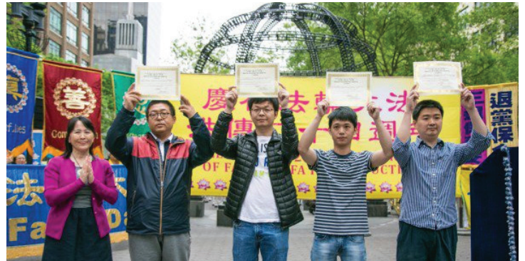
▲중국인들이 현장에서 '3퇴'(퇴당, 퇴단, 퇴대)하다.