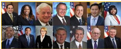
图：单独给法轮大法颁发褒奖的纽约州众议员们