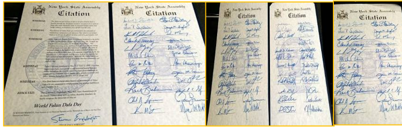
纽约州众议院褒奖令