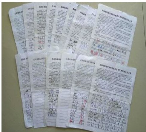
民众支持起诉江泽民的部分征签名单

【明慧网】（明慧网通讯员河北报道）河北省廊坊市部分市县自二零一五年九月至十二月下旬，有6096名法轮功学员亲属和民众签名举报江泽民以来，从二零一六年一月至四月初，据不完全统计，又有3142名民众联名签署举报江泽民，或支持起诉江泽民。