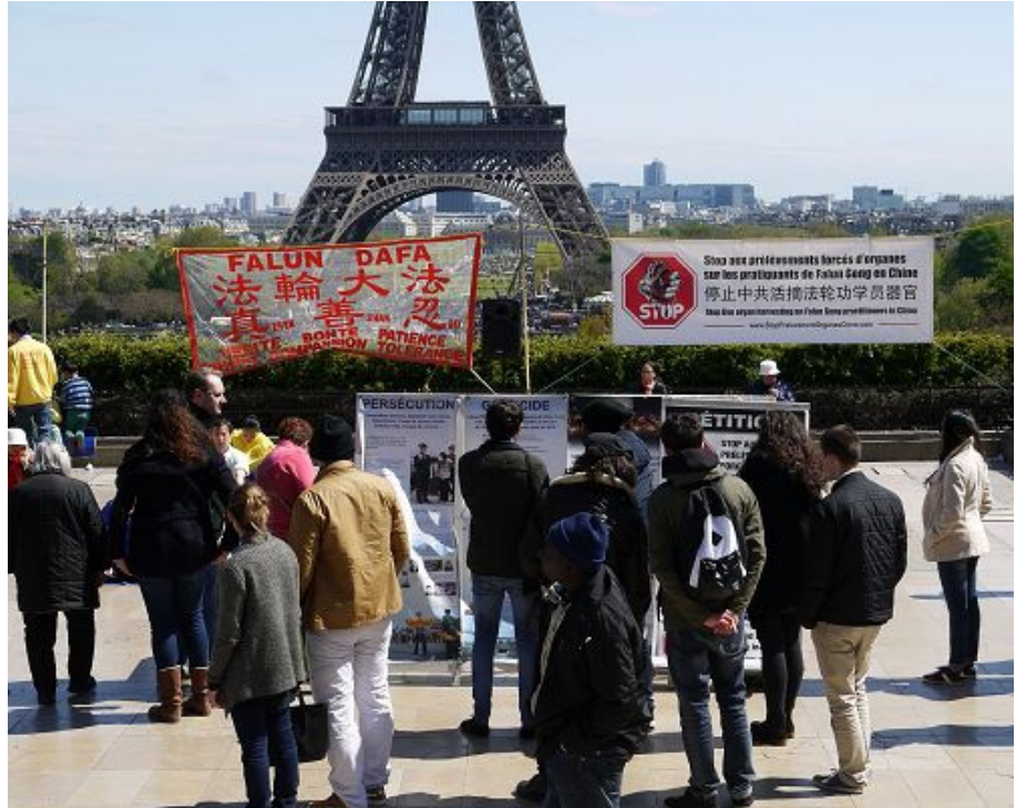
图：巴黎人权广场上游人观看法轮功真相展板

很多法国人以前不知道法轮功在中国被迫害的事实，他们认为迫害太不可想象、不可思议。有的说：“对法轮功修炼人的关押、迫害，以至摘取他们的器官，这是不正常的，是犯罪。”也有的说：“活体摘取人的器官，这不是人能干的事！是魔鬼！”