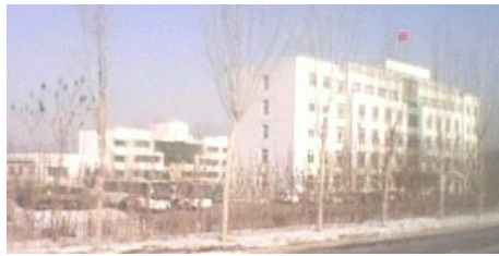
本溪劳教所的机关楼（前面的是本溪劳教所的机关楼，后面的是劳教人员的宿舍）

本溪劳教所，又称本溪威宁营劳教所，地处本溪市明山区高台子镇，是中共邪党在辽宁省迫害法轮功学员的主要场所。在一九九九年中共开始迫害大法不久，中共便开始大量的往本溪劳教所投钱，划拨上千万的专款用以迫害法轮功。本溪劳教所加强警力，建造群楼，更换设备，改换外观面貌，假装提高被关押人员的生活条件，建立所谓的辽宁省法轮功“转化”基地。它表面上环境幽雅，实行所谓校园式的管理，实质用来迷惑和欺骗世人，掩盖迫害法轮功学员的罪行。从一九九九年七月二十日到二零一一年间，辽宁省有七八个城市将非法劳教的法轮功学员绑架到本溪劳教所，估计已有五百多名各地法轮功学员在本溪劳教所遭受过迫害。凡被绑架到本溪劳教所的法轮功学员无一幸免都遭到了恶警及其利用的犹太的疯狂迫害。因为本溪劳教所所谓的“转化”率高，而成为邪党司法部的“先进单位”、“全国文明劳教所”、“辽宁省文明劳教所”。