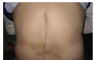
照片说明：大陆法轮功学员青岩康复后的后背照，可以看到，脊柱处的伤痕有15厘米。