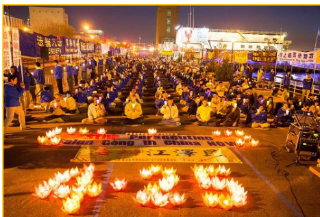
■ 海外法轮功学员纪念“4·25 和平上访”十七周年。（2016年4月）

多年对法轮功的迫害，没有动摇他们坚守“真善忍”的信念。他说：“这么好的功法，却不能让更多的中国人受益，让人痛惜。”