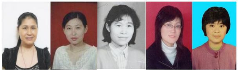
目前被劫持在江西省女子监狱的部分法轮功学员，从左往右：