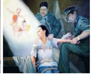
酷刑示意图：电棍电击、打毒针（绘画）

从此我开始了向大家讲清法轮功真相，这一讲就是十六年。我多次上访、自费发资料、面对面讲真相，受的那份冤枉罪，能铺满延庆的山。再苦再累再难，都压不垮我心里头对大法对师父坚如磐石的正信。只要大家明真相，我这心里就是甜甜的。