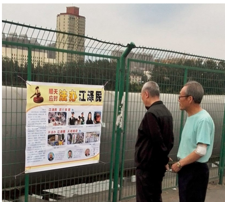
◀ 山西太原街头的控告江泽民的展板吸引路人观看（2016年6月）