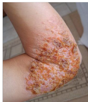
◀ 炼法轮功前（摄于：2015 年 12 月 12 日）

当我决定按照“真善忍”来提高自己的心性和归正自己的行为时，我感到心里亮堂起来。我心想，即使我的湿疹没有改善，知道“真善忍”本身就是无价的——我可以把这个理作为我余生的生活准则！