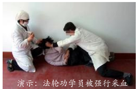
演示：法轮功学员被强行采血

【编者按：自2006年3月以来，中共活体摘取法轮功学员器官牟取暴利的黑幕在国际上被撕开。这场由中共前党魁江泽名下令进行的，由中共政府、军队统一管理，从监狱、法院、医院形成一条龙的秘密大屠杀，是对全人类的犯罪，是人类前所未有的罪恶，冲击着每一个人的良知，挑战着每一个人的道德底线。】