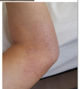
炼法轮功后（摄于：2016年2月27日）▶