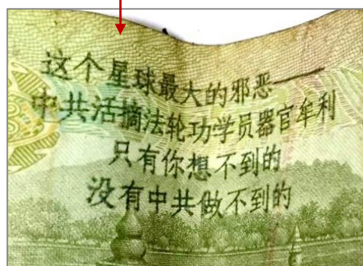
■ 印有字迹的人民币和局部放大图