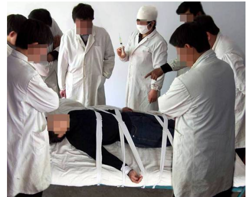
酷刑演示：打毒针（注射不明药物）

诉医生说我有精神病。我对医生说：“我没有精神病，我是炼法轮大法的，因为我说真话，说法轮大法好，他们就迫害我。”