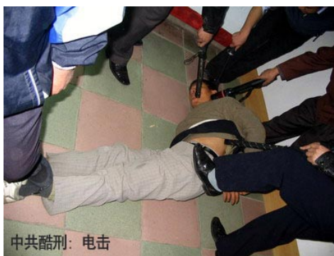
酷刑演示：电棍电击