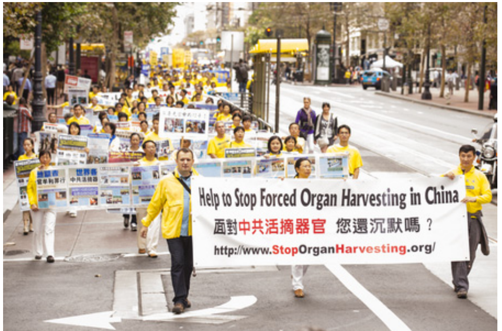
▲ 海外法轮功学员大游行，揭露中共活摘器官罪行。

◆ “遍布中国的大规模器官交易犹如恐怖电影，肝、肾、心、肺和眼角膜被从活着的良心犯身上摘下……”最新调查报告《血腥的器官摘取/大屠杀》近日在英国议会发布后，《外交家》杂志于 6 月 29 日登