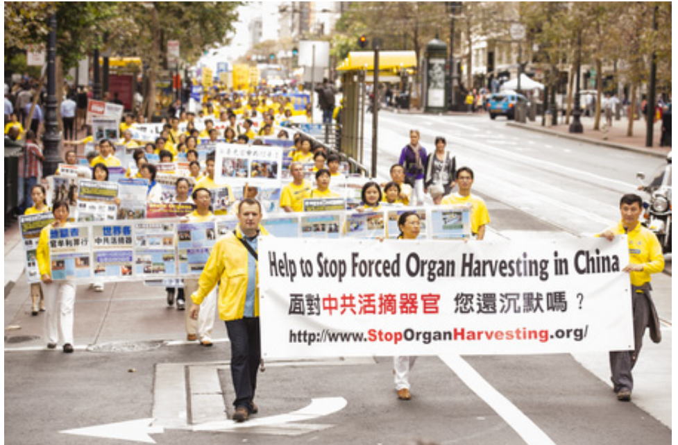
▲ 海外法轮功学员大游行，揭露中共活摘器官罪行。

◆ “遍布中国的大规模器官交易犹如恐怖电影，肝、肾、心、肺和眼角膜被从活着的良心犯身上摘下……”最新调查报告《血腥的器官摘取/大屠杀》近日在英国议会发布后，《外交家》杂志于6月29日登