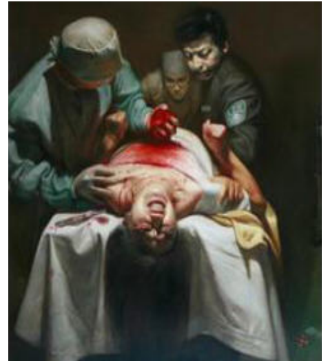
▲ 撷取自油画作品《活摘器官》全图的一部份，作者董锡强

二零一六年六月二十八日，澳洲新闻集团在其网站的国际新闻板块的大头条位置发表了题为《血腥的活摘：新报告揭示成千上万人被摘取器