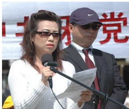
▲ 2006 年 4 月 20 日在白宫附近证人安妮与皮特现身揭露中共活体摘取法轮功学员器官的滔天罪行。

一位化名安妮的女士说：秘密集中营就设在辽宁血栓医院的“地下医疗设施”里。她的前夫就是苏家屯集中营活体器官摘除主刀医生之一，他是脑外科医生，主要从事眼角膜摘取。二零零一年至二零零三年间该医院曾关押法轮功学员约 6000 人，超