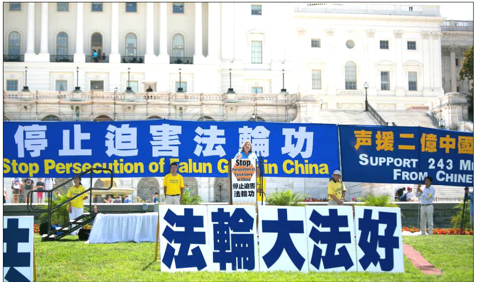
2016 年华盛顿 DC 法轮功反迫害大集会。罗斯·雷婷恩议员在现场发言。

作为国会众议院 343 号决议案的发起人罗斯·雷婷恩议员表示，这一决议案在国会通过是巨大的胜利，表明美国国会众议院用一致的声音宣布，他们知道中共政权的对法轮功学员犯下的种种恶行，包括酷刑、屠杀和血腥的器官活摘。她说，“美国国会众议院这个神圣的机构，这一代表自由、正义、尊重人权的机构，通过决议确认，这些令人发指的罪恶正在发生。今天，我很自豪地和你们站在一起纪念这一胜利。”