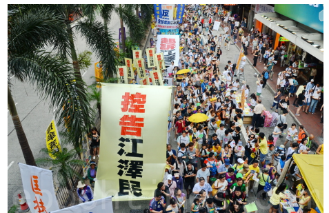
▲ 2015年7月，香港大游行中“控告江泽民”的巨型标语。

直接参与了迫害、又直接遭受迫害的社区人员应该义不容辞地起来抵制迫害，共同携手结束迫害，早日解脱自己的被迫害。何苦挖空心思欺下瞒上，惶惶恐恐地为罪犯江泽民继续卖力卖命，出卖自己的良知呢？◇