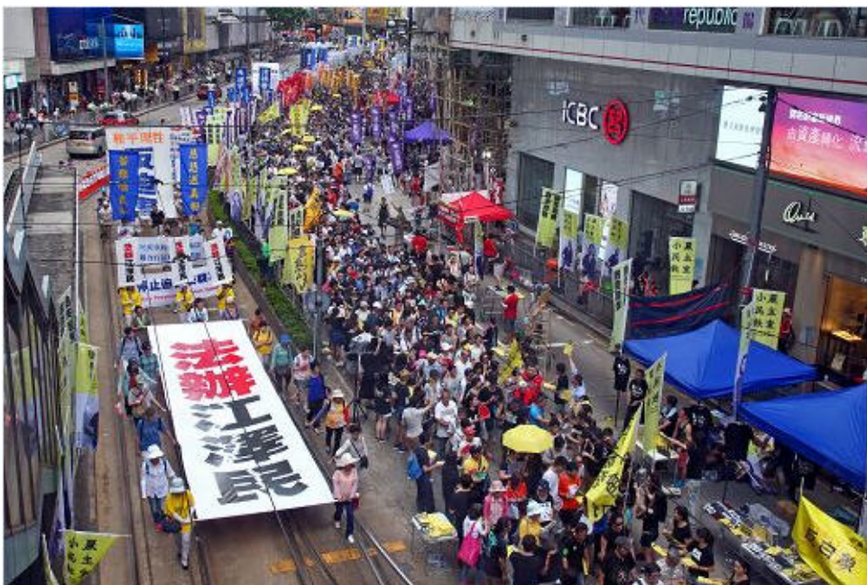
▶ 今年香港七一大游行，民众举着“法办江泽民”的横幅，声援诉江大潮。

二零一五年五月诉江大潮兴起，向中国最高检察院、法院实名控告江泽民罪行的中国民众已超过二十万人；世界各国民众，包括国会议员，政要，知名人士也站出来声援，仅亚太地区联署举报江罪、声援诉江的人