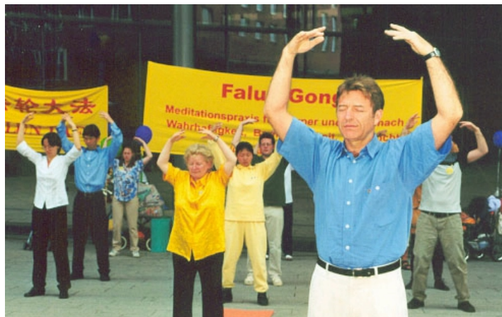
■ 德国法轮功学员在集体炼功（摄于2001年5月）

含佛家和道家的元素。法轮功修炼者努力让自己的行为符合“真、善、忍”，并且通过炼功达到健康。在中国，这个功法正在被残酷迫害，当局认为那是另一种世界观，对共产主义（假、恶、斗的世界观）是一种威胁。◇