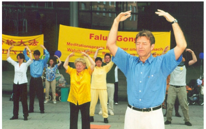
■ 德国法轮功学员在集体炼功（摄于2001年5月）

含佛家和道家的元素。法轮功修炼者努力让自己的行为符合“真、善、忍”，并且通过炼功达到健康。在中国，这个功法正在被残酷迫害，当局认为那是另一种世界观，对共产主义（假、恶、斗的世界观）是一种威胁。◇