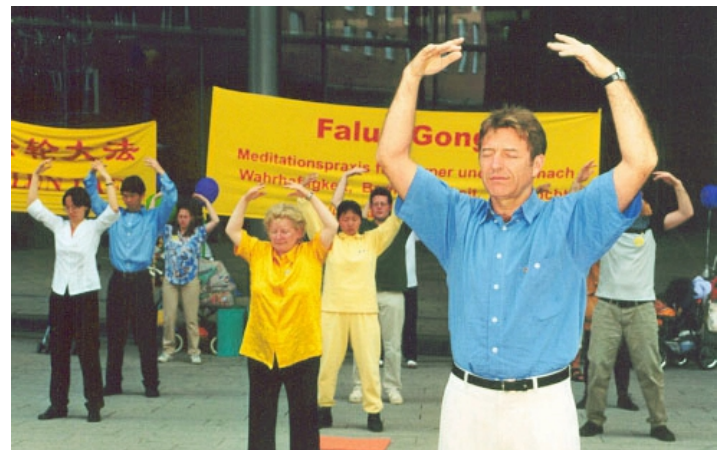
■ 德国法轮功学员在集体炼功（摄于2001年5月）

含佛家和道家的元素。法轮功修炼者努力让自己的行为符合“真、善、忍”，并且通过炼功达到健康。在中国，这个功法正在被残酷迫害，当局认为那是另一种世界观，对共产主义（假、恶、斗的世界观）是一种威胁。◇