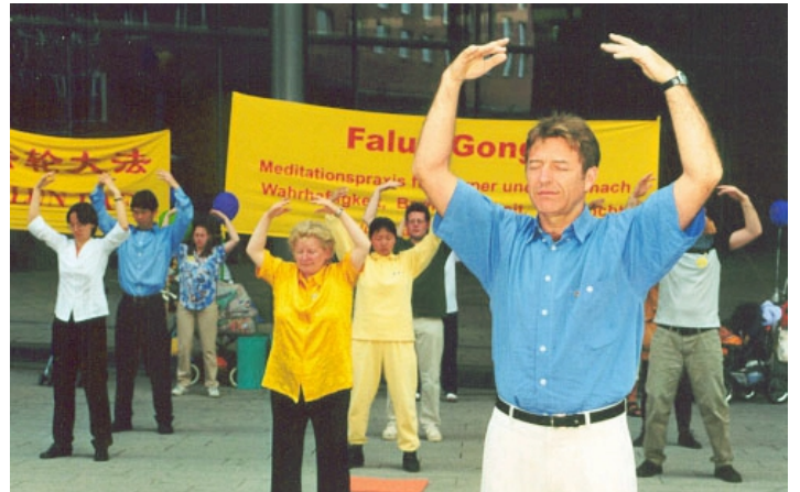
■ 德国法轮功学员在集体炼功（摄于2001年5月）

含佛家和道家的元素。法轮功修炼者努力让自己的行为符合“真、善、忍”，并且通过炼功达到健康。在中国，这个功法正在被残酷迫害，当局认为那是另一种世界观，对共产主义（假、恶、斗的世界观）是一种威胁。◇