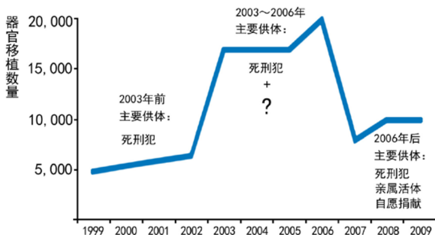
中国器官移植数量趋势图 (根据中共官方公布的部分数据)

中国大陆器官移植的数量，2003年以前为每年5000 ~ 6000例，2003-2006年猛增到每年1.2万 ~ 2万例，2006年以后每年不到1万例，但仍然维持在比2003年前更高的水平。那么，2003年起猛增的这些被移植的器官来源于哪些人呢？真的是死刑犯吗？