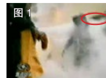
图 1 凶手猛击刘的头