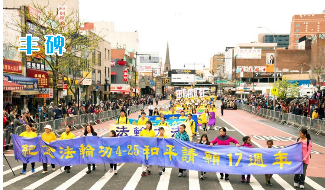
2016 年 4 月 23 日，法轮功学员于纽约游行

运动：三反、五反、反右、四清、文革等等。他们都知道中共的独裁与邪恶，都知道中共邪党是什么都能干得出来的。他们甚至在去国务院信访办的前夕，把遗书都写好了！