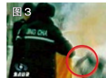
图 3 用手摸头，突然倒地