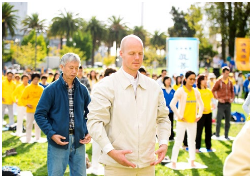
▲ 奥运滑雪铜牌得主马汀斯·鲁本尼斯在大炼功中