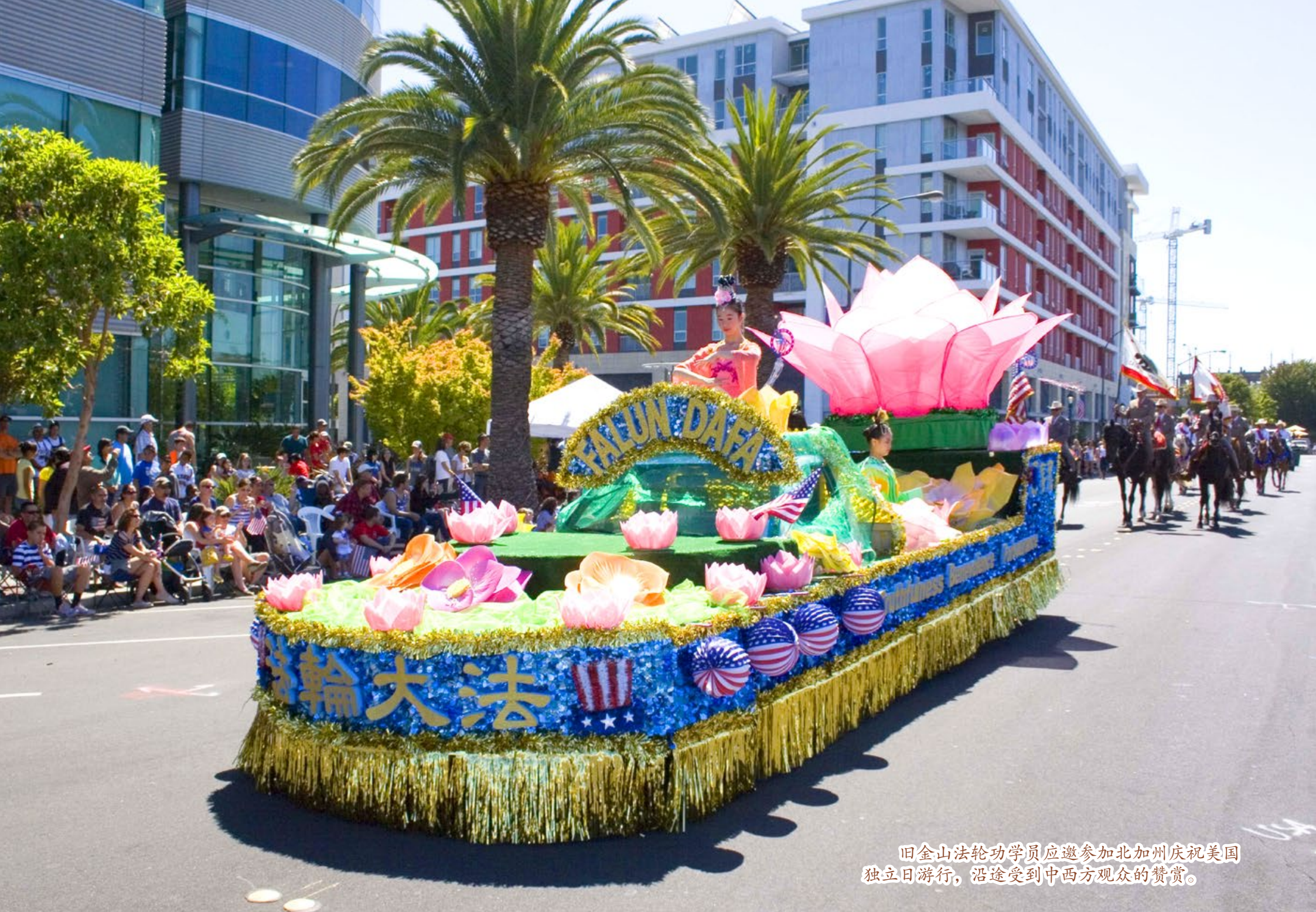
旧金山法轮功学员应邀参加北加州庆祝美国独立日游行，沿途受到中西方观众的赞赏。