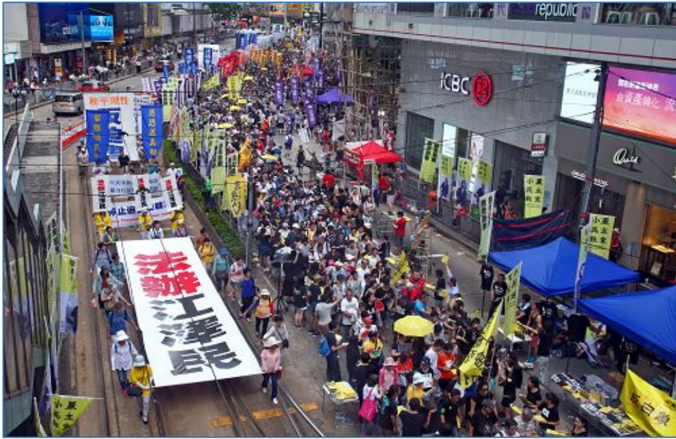
■今年香港七一大游行, 民众举着“法办江泽民”的横幅, 声援诉江大潮