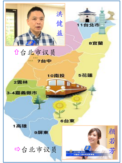
台湾声援中国民众告江地图一