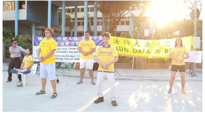
■ 里约奥运会期间，法轮功学员在旅游景点开设真相展点