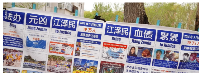
全国江泽民各地展出板现控

周永康、薄熙来、李东生等许多迫害法轮功的凶手已经纷纷落马成为阶下囚，看似权斗，其实都是天惩的恶报在兑现之中。当年，他们迫害法轮功学员时是何等的张狂，哪个不是凶神恶煞，根本不把法律和老百姓放在眼里，这些人作恶时，何曾想到会有今天的下场？◇