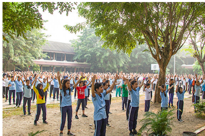
■ 印尼“和谐”学校师生炼法轮功