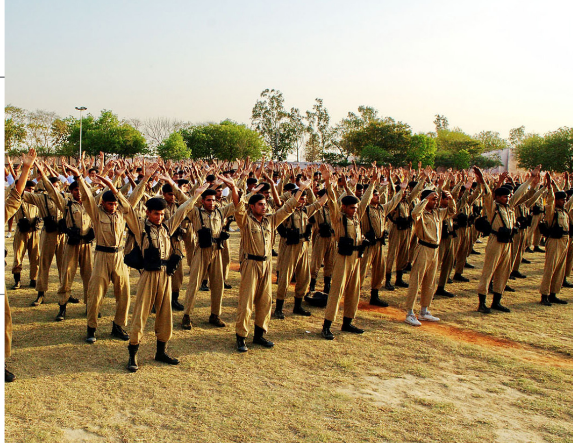
■ 印度警察学校学生在炼法轮功。

就在妈妈身体和精力走下坡路的时候，她听说法轮功不但祛病健身有奇效，而且还可以提高人的思想境界，妈妈由此开始炼功和阅读法轮功著作。这样她更忙了。但是尽管如此，她精神状态却越来越好，看上去也不那么疲劳了，面容也不憔悴了，人也变得更加祥和。单位的同事和左邻右舍都夸她比以前乐观了，而且她还经常帮助别人，主动打扫楼道卫生，为大家做好事。我知道《转法轮》书里讲了如何做好