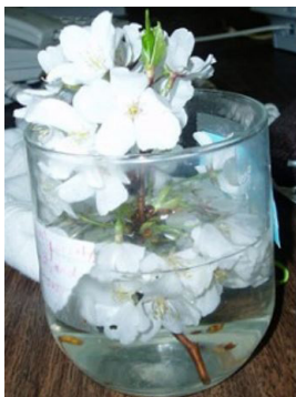
■ 图 1-1