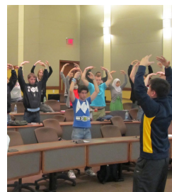
■ 中国大学学生炼法轮功

看到法轮功在世界各国校园受到欢迎的场景，您可能会感到惊讶。其实全世界这么多国家，唯独中共在迫害法轮功，这不令人深思吗？◇