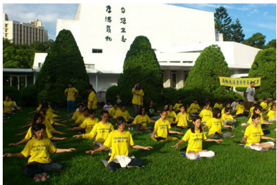
■ 台湾清华大学学子在集体炼功

在欧洲、美洲的许多校园里，都有法轮功炼功点。在举世闻名的英国剑桥大学——国王学院楼前广场上，傍晚，伴随着夕阳的霞辉，法轮功学员炼功的身影，给这所古老的著名学府带来了温馨的气息。