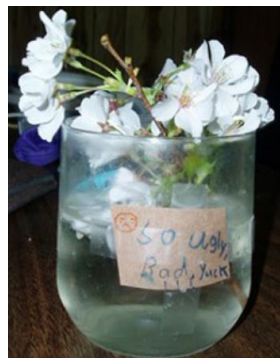
■ 图 1-2