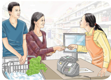
■ 有一次我和妈妈去超市买东西，后来她发现收银员少收了她十几元钱，她马上返回去送钱。

母亲常跟邻居说：“如果没有法轮大法，我和儿子不会有今天。”母亲面对不懂事、不服管教的孩子，没有放弃；面对社会的压力，没有低头，因为她知道法轮大法教人要做好人、无私的人。所以她堂堂正正地做人，给我、给她周围的人，事事处处都做出了榜样。◇