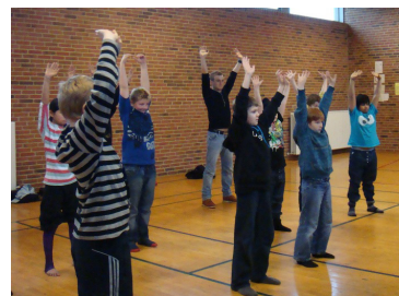
■ 丹麦的学生在学炼法轮功