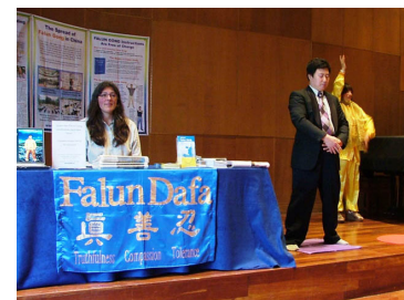
■ 英国剑桥大学学生炼法轮功