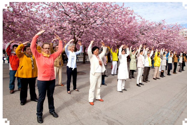
瑞士法轮功学员在花园炼功

大三期间，我曾作为交流生到欧洲学习了半年时间。在那里我真正体验到了有自由信仰民族的人们生活。在当地一著名的步行街，那熟悉悠扬的法轮功炼功乐曲在我耳边响起，我看到了海外法轮功学员在户外炼功的场面。在那一瞬间，我热泪盈眶，百感交集，也真心希望终有一天，大陆也能回归这样的净土！◇