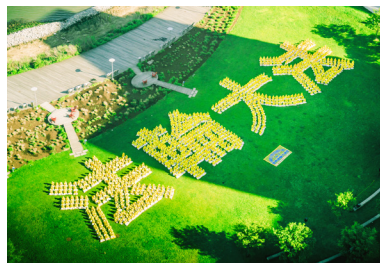
△ 千余名法轮功学员在联合国总部大楼对岸甘纯公园排出“法轮大法”四个大字。