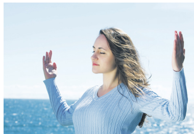
△ 美国女孩在炼“法轮桩法”，她沉浸在静谧与祥和里。天与海连成一片，与心融在一起。