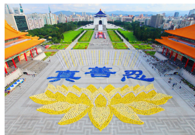
△ 5000多名法轮功学员在台北自由广场排出了优美的莲花座与“真善忍”三个大字。