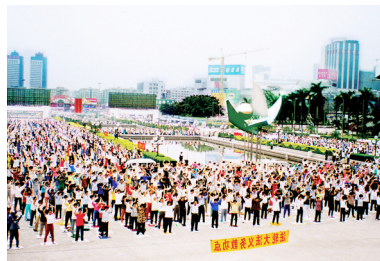
△ 1998年，中国广东省广州市一个炼功点的法轮功学员们在晨炼。广州电视台做了报道。

然而，李有甫却始终为没能找到高层次的修炼方法而彷徨，他苦苦地寻觅着。1996年，李有甫终于得到了《转法轮》一书。他非常激动：“当我第一次拿到《转法轮》时，我一口气读完了全书，一边读一边流泪。我寻觅了半辈子，终于找到了如此纯正高深而又实实在在的高德大法。”