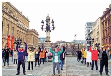
△ 在欧洲的50个国家中，法轮功弘传46个国家。城市乡村，法轮功炼功点到处可见。