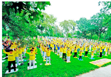
△ 美国纽约中央公园的草坪上，数百名来自世界各地的法轮功学员集体炼功，场面祥和。

父子的巨变，让史蒂文的妻子罗泊塔无限感慨：这对于我来说，真的是梦想成真，这真是太太好了！非常感谢李洪志先生将法轮功带入我们家，是法轮大法托起我们幸福的家。