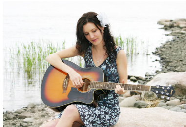
△ 芬兰民谣新星安娜·科克宁，修炼法轮大法已经11年，她变得更加淡泊、从容。

拥有自己唱片公司的安娜说：“我从2006年开始修炼法轮大法后，感到身体很轻松，能够更好地平衡自己的心态，这种感觉真好。特别是阅读法轮大法书籍的时候，内心祥和而宁静。”