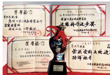
△ 1993年东方健康博览会，李洪志先生获最高奖项“边缘科学进步奖”和“特别金奖”。

妻子做手术后第8天，我们就回家了。妻子说要修炼法轮功，我就给妻子念《转法轮》，炼功后不久，妻子的身体奇迹般地痊愈了，我们家重新充满了温馨与快乐，对法轮大法的感激无以言表。如果妻子不修炼法轮大法，早就如肿瘤医院诊断的结果，不在人世了。如今，妻子活得比一般年轻人还好。我相信，妻子的经历会使医院的医生们及更多的人思考：为什么那么多法轮大法修炼者，在江泽民发动残酷迫害的情况下，仍然不放弃修炼；仍然冒着生命危险，告诉人们法轮大法的真相。