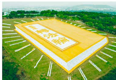
△ 6千多名法轮功学员在台湾台中外埔乡排出《转法轮》一书的立体画面，极为壮观。

法轮功至今已弘传100多个国家和地区，受到世界人民的爱戴和尊敬。《转法轮》被翻译成30多种语言，在全世界各地出版发行，并可在法轮大法网站（ falundafa.org ）上免费下载。