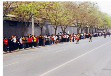
△ “4·25” 上访现场。站在北京中央信访办便道上上访的法轮功学员，秩序井然。

然而，踏着“六四”学生鲜血上台的江泽民，急欲树立个人权威，仇恨妒嫉法轮功修炼人数众多，一直背后指使公安部个别人对法轮功进行暗中调查和监控，为迫害法轮功寻找借口。1999 年 7 月 20 日，江泽民以 4 月 25 日法轮功学员和平上访为借口，诬蔑法轮功学员围攻中南海，不顾其他政治局常委的反对，利用中共对法轮功修炼者展开了长达 17 年的残酷迫害。