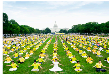
△ 来自世界各地的数千名各族裔法轮功学员，在美国华盛顿国会山庄前集体炼功。

最终，杨景端选择了法轮大法。他说：“读完李洪志先生的著作《转法轮》，我明白了健康的本质是什么。书中系统地阐述了‘真善忍’的深刻内涵，人不断地用这个标准衡量和要求自己，就在不断地升华；《转法轮》中指出‘整个人的修炼过程就是不断的去人的执著心的过程’。法轮大法摒弃一切外在仪式，直指人心，重在内修。在修心、提高道德境界的同时，五套简单优美的功法使身体同时得到净化。其功效是我自己和所有认真修炼的人亲身体验到的，我渐渐洞悉到人和宇宙，乃至生命的起源与归宿。修炼后，我身体非常健康，我更珍惜我的时间和生命。科学，是用已知探索未知，而不是用已知否定未知。”