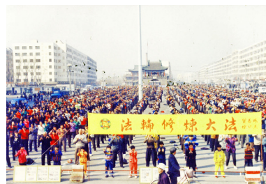
△ 1999年5月，中共迫害法轮功之前，黑龙江双城市法轮功学员在东门广场集体炼功。