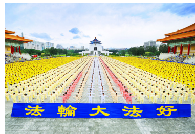
△ 7500 多名法轮功学员在台北自由广场集体炼功，宏大场面吸引了许多游客观看。

现在已经 70 岁的胡医师皮肤光滑、细嫩，脸色白里透红，鹤发童颜，精神奕奕。有人问胡医师有什么养颜秘诀？胡医师说唯一的秘诀是：“修炼法轮功！法轮功讲‘真善忍’。一个人的健康与道德水平有着紧密关系。有德之人就活得长，‘真人’与天地同寿，‘圣人’可以活至百岁。”