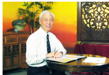
△ 胡医师说他接触过很多修炼方法，发现法轮功是真正性命双修的上乘修炼方法。