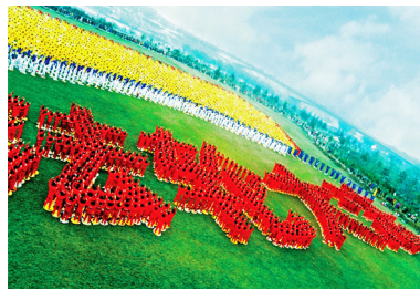
△ 1999 年，在武汉市汉阳汉水公园，近万名法轮功学员排出“法轮大法”四个大字。

注：法轮功是佛家上乘修炼大法，不是专门用于治病的功法，但修炼者可祛病健身，延年益寿。