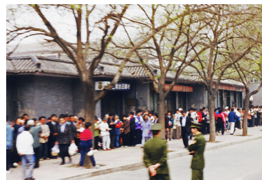
△ “4·25” 上访现场。法轮功学员没有口号、没有激动的情绪。警察在悠闲地聊天。