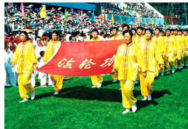
△ 1998 年 8 月，沈阳法轮功学员受邀参加亚洲体育节开幕式，法轮功学员列队入场。

这位篮坛宿将就像凌风傲霜的菊花，在苦寒中保持着高洁与坚韧，守护着她心中无悔的信仰！